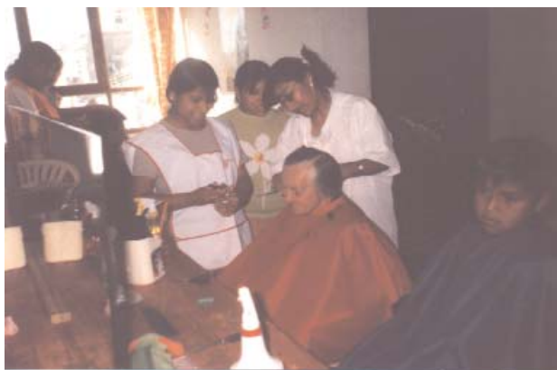
Taller de peluquería