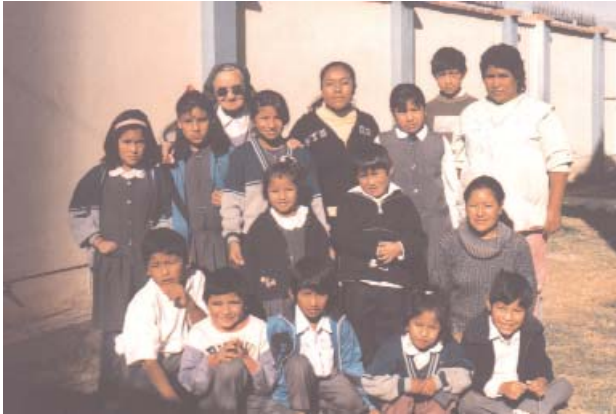
Hogar en Vinto-Mixto