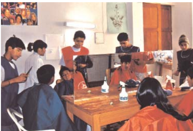
Taller de peluquería